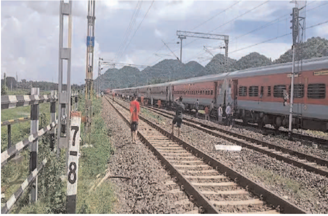
దిమ్మెలు, ఇసుక దిబ్బలు ఉన్నాయి. ఇలాంటి ఘటనలు ఎక్కువగా ఉత్తరప్రదేశ్ లోనే వెలుగు చూడగా.. ఆ తర్వాత పంజాబ్, జార్ఖండ్, రాజస్థాన్, మధ్యప్రదేశ్, ఒడిశా,

దేశంలో రైలు ప్రమాదాలకు దారి తీసేలా కుట్రపూరిత ప్రయత్నాలు అందోళన కలిగిస్తున్నాయి. ట్రాక్ పై గ్యాస్ సిలిండర్లు, ఇసుక పట్టీలు ఉంచుతూ రైళ్లను పట్టాలు తప్పించేందుకు కుట్రలు పన్నుతున్నారు.