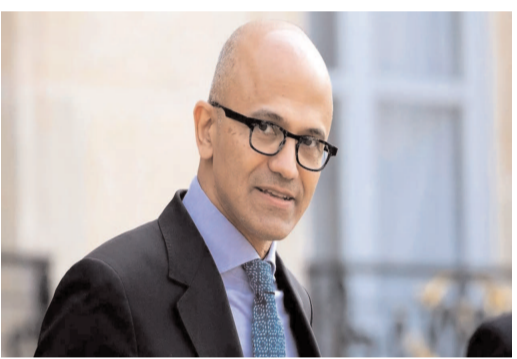
ఆర్థిక సంవత్సరంలో మైక్రోసాఫ్ట్ గణనీయమైన వృద్ధి సాధించింది. దీంతో కంపెనీ షేర్లు 31.2 శాతం లాభపడ్డాయి. అలాగే మైక్రోసాఫ్ట్ మార్కెట్ విలువ 3 ట్రియల్ దాల్చి దాడింది. దీంతో సత్య నాదెళ్ల స్టాక్ అవార్డులు 38 మిలియన్ డాలర్ల నుంచి 71 మిలియన్ డాలర్లకు పెరిగాయి.

న్యూఢిల్లీ : సత్యనాదెళ్ల. ప్రముఖ టెక్ సంస్థ మైక్రోసాఫ్ట్ సీఈవో. దాదాపు ఐదేళ్లుగా ఆయన ఈ పోజ్ లో కొనసాగుతున్నారు. కంపెనీ సీఈవో కావడానికి ఎంత శ్రమించారో.. సీఈవోగా ఇప్పుడు కంపెనీ వృద్ధికి అంతకన్నా